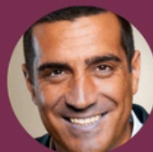
Michele De Pascale Presidente Regione Emilia Romagna (video)