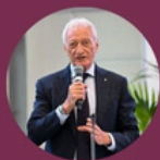
Luciano Buonfiglio Presidente CONI