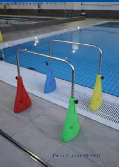
Dips Station SHORT

Attrezzo innovativo che consente esercizi mirati su muscoli stabilizzatori, addominali, arti superiori e zona lombare , anche a basse profondità. Adatta a corsi monotematici, circuiti fitness e applicazioni riabilitative. Disponibile in due lunghezze .