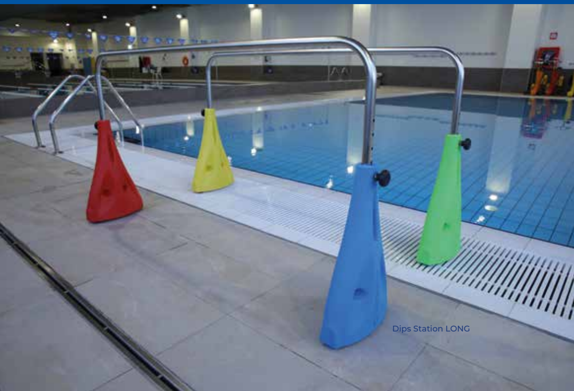
Dips Station LONG

codice IDR.P 0017 CB materiale Acciaio inox (AISI) 316 L larghezza 34 cm altezza 75 / 105 cm profondità d'impiego 75 / 145 cm lunghezza: SHORT 85 cm - LONG 160 cm peso: SHORT 6 kg - LONG 7.5 kg