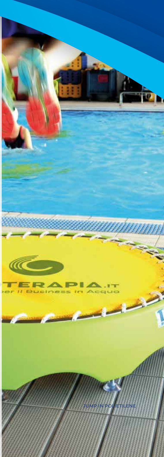
JUMP IN POLIETILENE