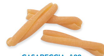
CASARECCIA n° 88