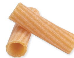
TORTIGLIONI n° 23