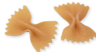
FARFALLE n° 93