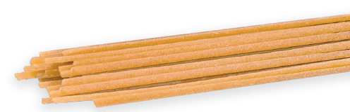
LINGUINE n° 7