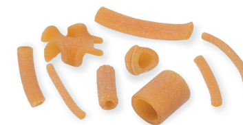
PASTA MISTA n° 120