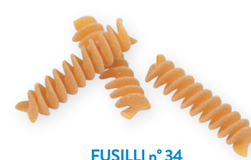
FUSILLI n° 34