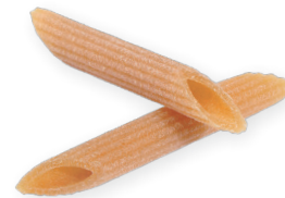
PENNE RIGATE n° 41